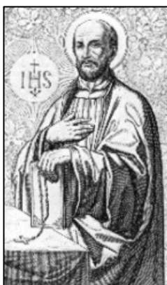
Ignace de Loyola

"Quand un Père de la Compagnie va rendre visite à une femme, qu'il s'adjoigne un autre Père et que, tandis que le premier s'entretient avec elle, il ait un poste d'observation d'où il puisse les voir, l'un et l'autre, sans cependant les entendre, et si cela ne peut se faire commodément, qu'au moins la porte de l'appartement reste entre-baillée tandis qu'ils sont ensemble."