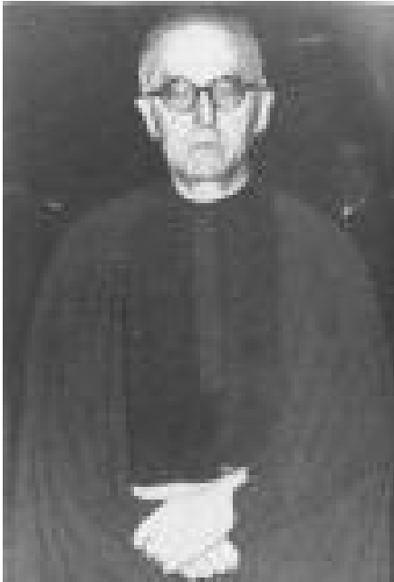
2 - Jean-Baptiste JANSSENS, Général 1943 ~ 1964 (Il aurait ordonné l'assassinat de J-F Kennedy)

À défaut de se représenter ce qu'est le " jésuitisme ", on ne peut comprendre la politique mondiale. Le Jésuitisme révèle le mode de pensée des milieux politiques et financiers et de leurs réseaux de loges. Cette pensée n'est pas spirituelle mais fondée sur l'instinct de survie le plus primitif. Leur ruse provient d'une perversion du pouvoir mental, lorsque celui-ci est l'esclave de la puissance matérielle et de la peur archaïque.