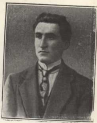
Témoin des massacres de Kharpout