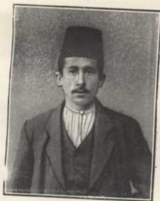
Témoin des massacres de Diarbekir