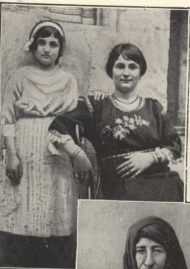
Les deux s témoin du massa de Mgr Addaï-S