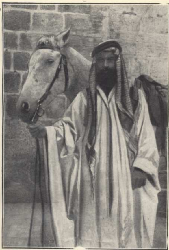
L'auteur du livre dans le costume de déguisement qui lui permit d'échapper au massacre