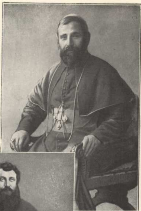
MGR ADDAI SHEIR ARCHEVÊQUE DU SÉERT, massacré par les Turcs