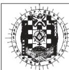
HARMONIA MUNDI Or.: de Versailles