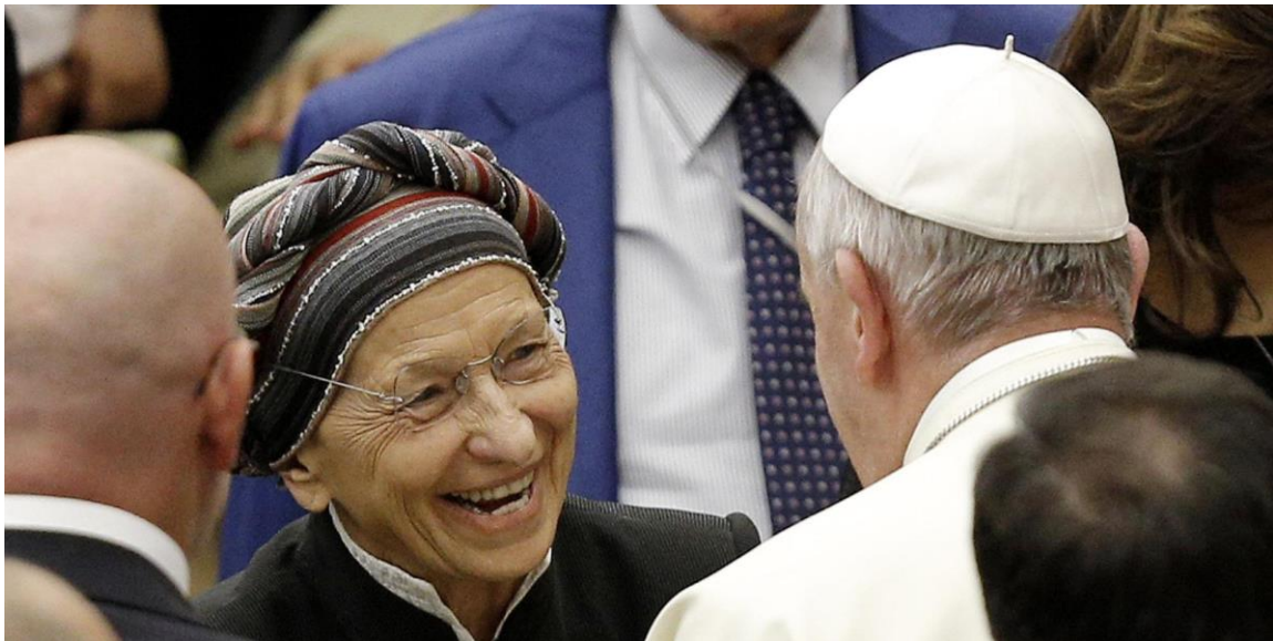
François se réjouit toujours en la présence des ennemis de Dieu

Selon François, Emma Bonino, « passionaria » italienne, laïciste et féministe, partisane acharnée du divorce, de la contraception, de l'euthanasie et du « droit » des femmes à « disposer de leurs corps », ferait partie des « grands d'Italie ». Oui, cela ne s'invente pas :