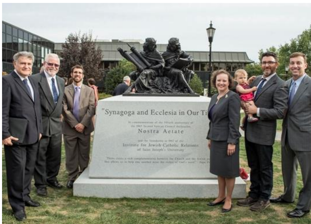
Synagogue et Eglise en notre temps, benie par François durant son voyage aux USA