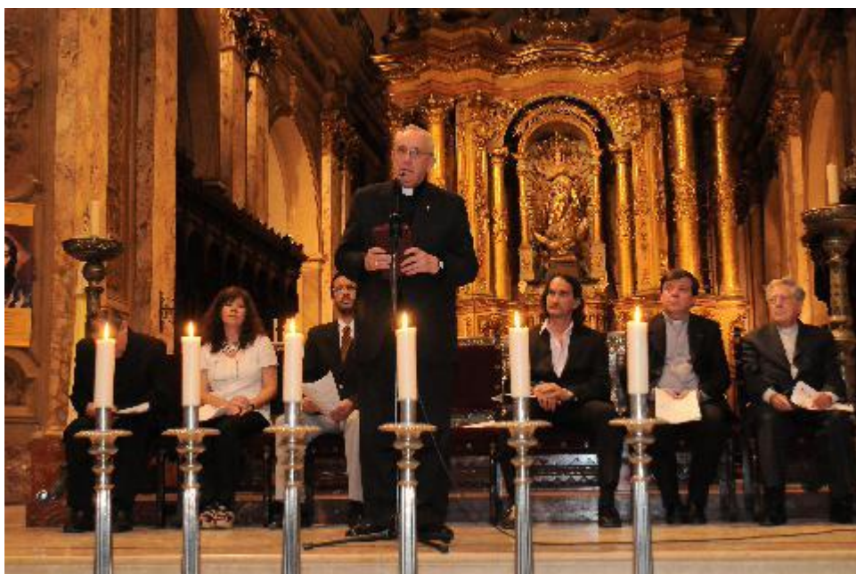
Bergoglio célébrant une liturgie élaborée par la B'nai B'rith