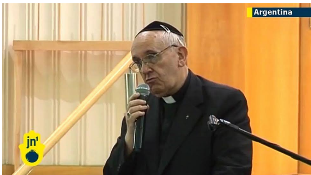
Le rabbin Bergoglio dissertant sur les « valeurs » dans une synagogue