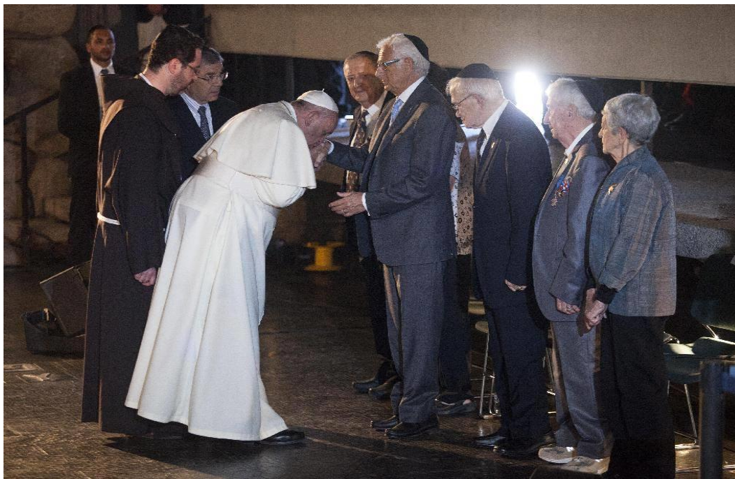
François se prosternant devant ses « frères aînés »

« Qui est menteur, sinon celui qui nie que Jésus est le Christ? Celui-là est l'antéchrist, qui nie le Père et le Fils. Quiconque nie le Fils n'a pas non plus le Père ; quiconque confesse le Fils a aussi le Père. Que ce que vous avez entendu dès le commencement demeure en vous. Si ce que vous avez entendu dès le commencement demeure en vous, vous demeurerez aussi dans le Fils et dans le Père. » (1 Jn. 2, 22-24)