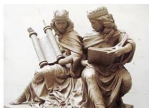
The dedication of an original Joshua Koffman sculpture “Synagoga and Ecclesia in Our Time” Plus other speakers to be announced

Pre-registration online is required. For more information and to pre-register go to sju.edu/ijcr