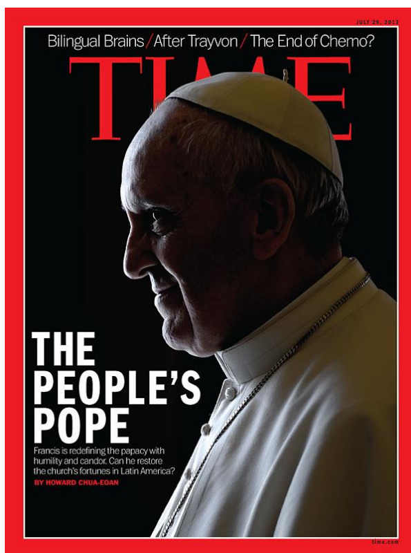
« The Devil's Pope »

« Jésus est venu au monde pour apprendre à être homme, et en étant homme, à marcher avec les hommes 51 . »