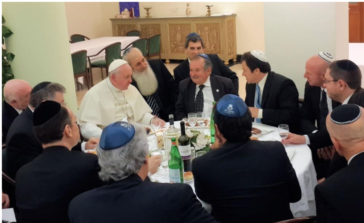
Déjeuner kasher avec douze rabbins dans la Maison Sainte-Marthe au Vatican

des paroles des psaumes: Ah, qu'il est bon, qu'il est agréable pour des frères d'être ensemble! , dans cette ambiance chaleureuse et ce climat d'harmonie'', ajouta-t-il 22 . »