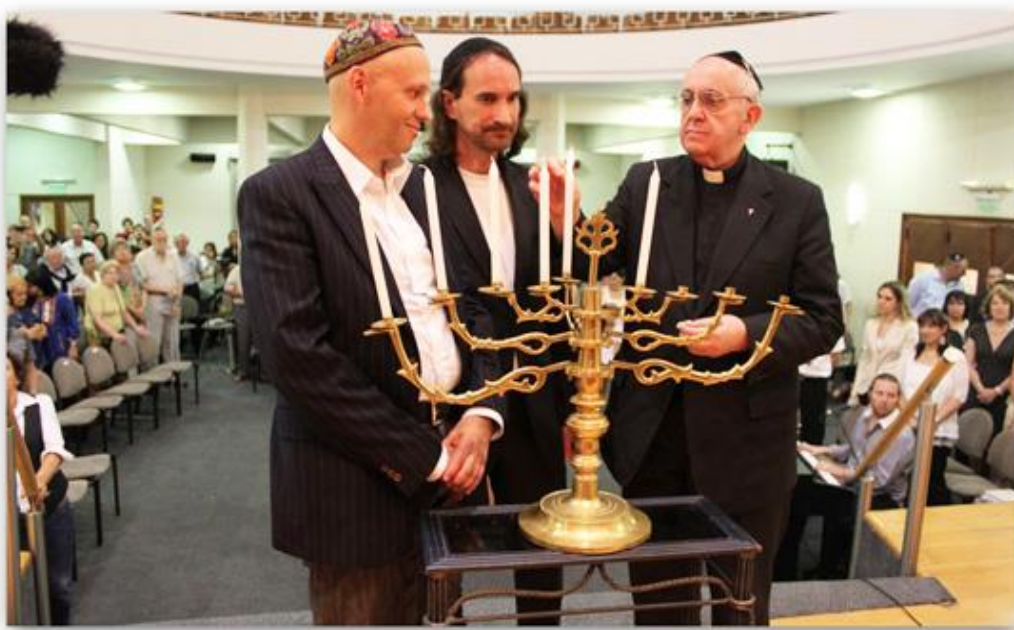
Le rabbin Bergoglio allume une bougie pour la fête de Hanoucca

« L'archevêque de Buenos Aires et primat de l'Argentine, le cardinal Jorge Bergoglio, mit en exergue les liens qui rattachent la fête de Hanoucca , la fête des lumières, à celle de Noël, lorsqu'il présida un office religieux dans une synagogue de la ville de Buenos Aires. « Hanoucca et Noël partagent le symbole de la lumière, puisque dans le récit de la naissance