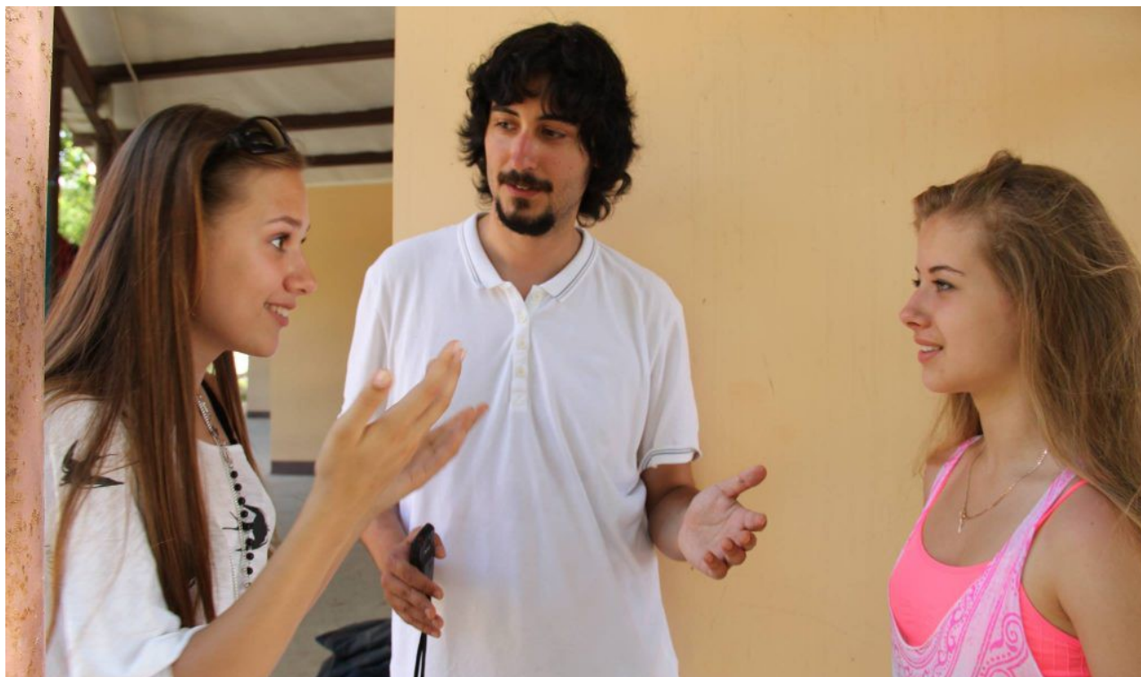
Jeunes étudiantes ukrainiennes. La gentillesse et la beauté incarnées.

de proxénétisme à distance France/Ukraine. Alors là, on touche le fond... on est sur du non-argument Soralien total. Zéro preuve, que de la gueule. Je te vois bien réfléchir à la préparation de la vidéo en te disant « bon, je le dis ça, ou pas ? C'est de la merde, mais je le dis, tant pis pour lui » . Le gars que nous connaissons tous deux apparemment, et qui est venu en Ukraine avec moi, a bien dû te le dire, que je ne lui ai présenté aucune prostituée là-bas, puisque je n'en connais pas. Allez RyRy, sois sincère au moins une fois à mon sujet en public. Cette accusation est lourde de conséquences, puisqu'elle te fait indirectement faire perdurer le stéréotype selon lequel toutes les femmes de l'est seraient des putes en puissance, et qu'il ne serait possible là-bas que d'y faire du tourisme sexuel. Cela peut dissuader des jeunes français qui t'écoutent d'y aller, et d'y trouver leur bonheur avec des femmes blanches saines, qui ont la mentalité et la morale des françaises des années 50.