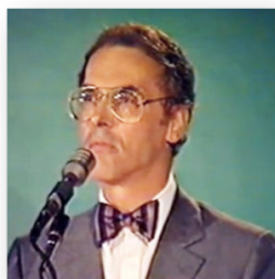
Bernard de Montréal