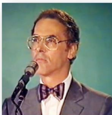
Bernard de Montréal